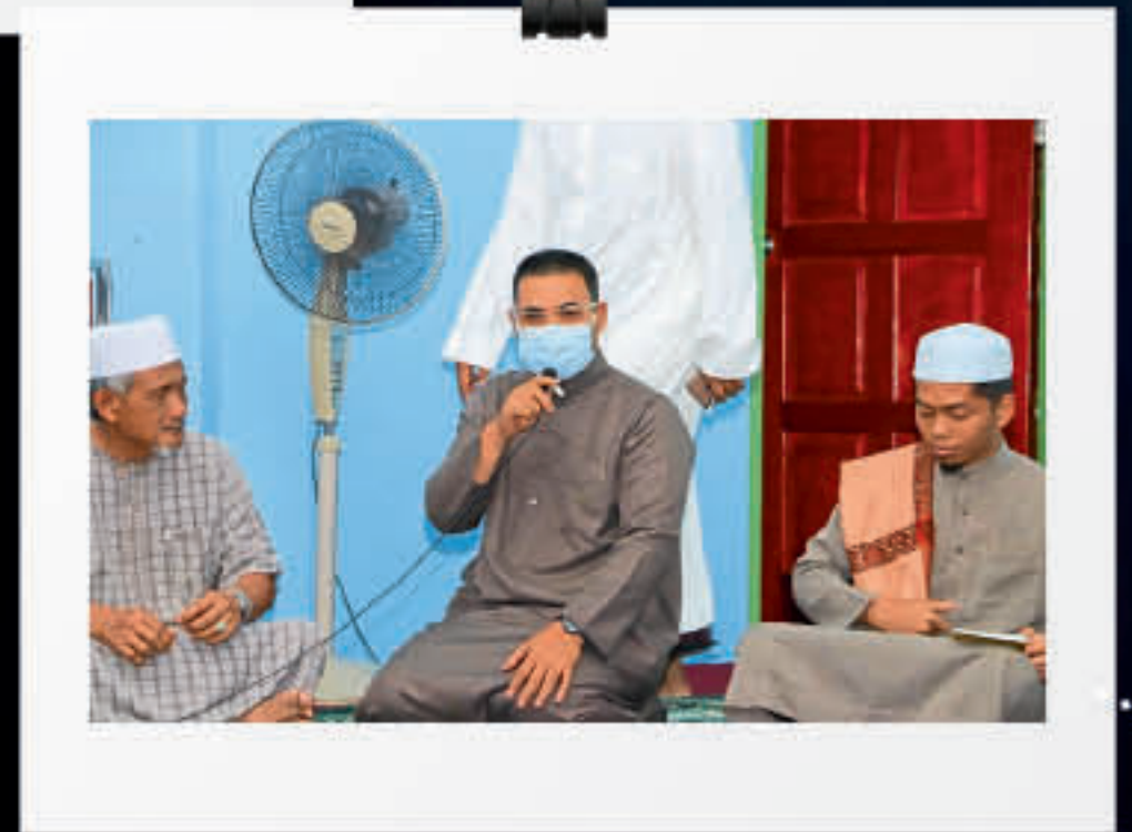
Ihya' Ramadan Bersama Masyarakat