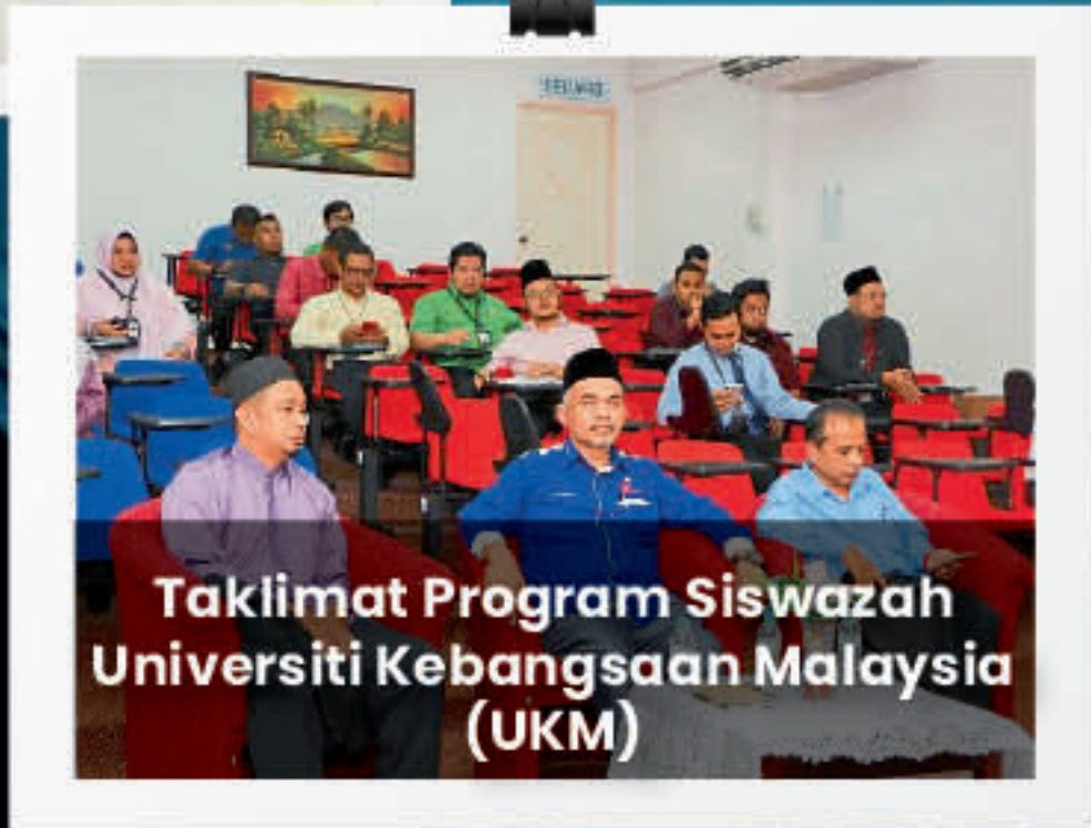
Taklimat Program Siswazah Universiti Kebangsaan Malaysia (UKM)