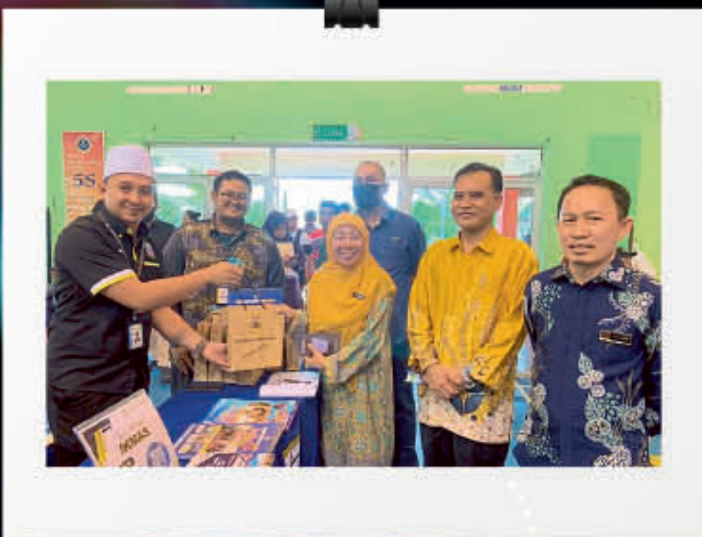
Pameran Pendidikan IKMAS Sempena Pengumuman SPM 2022