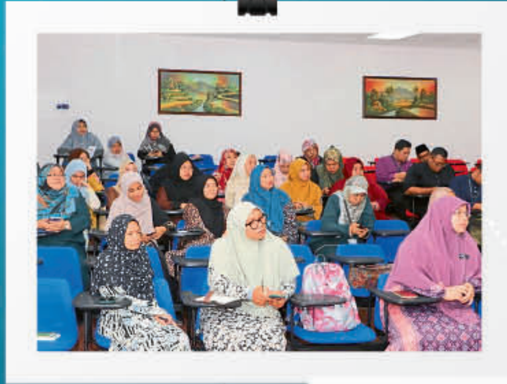
Taklimat Kesedaran Kanser Serta Penerangan Program "My Pledge Against Cancer" (MPAC) Makna