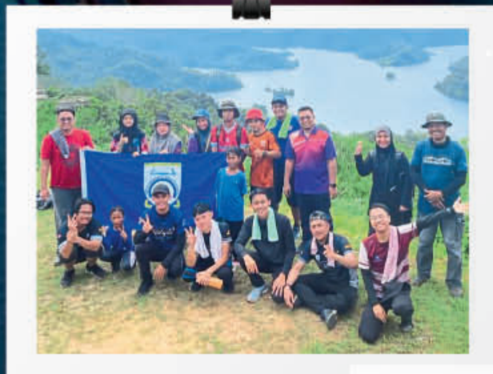
Trip Ke Bengoh Dam Anjuran Kelab IKMAS