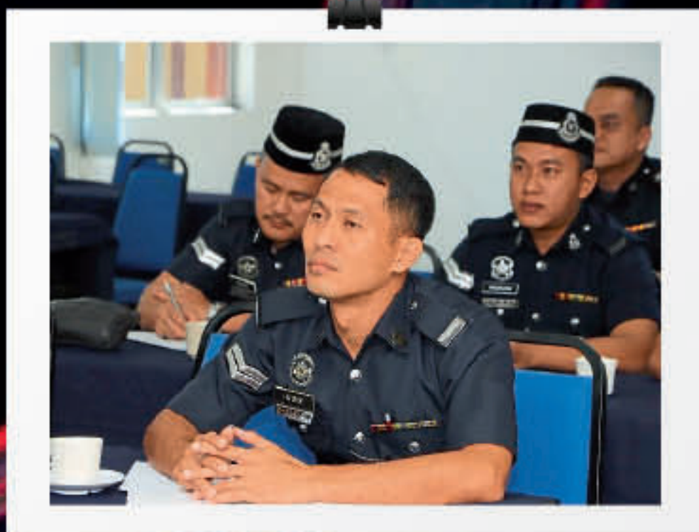
Kursus Penyampaian Khutbah Berkualiti