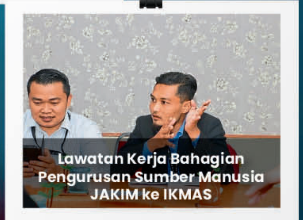
Lawatan Kerja Bahagian Pengurusan Sumber Manusia JAKIM ke IKMAS