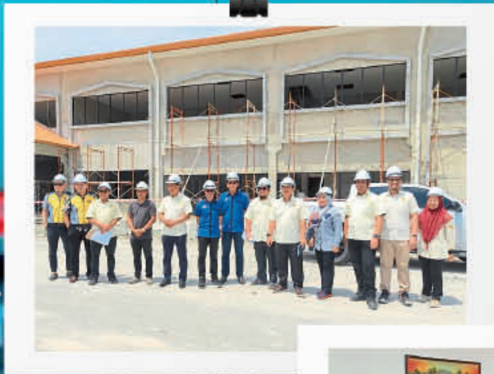
Lawatan Timbalan Ketua Pengarah Pengurusan Ke Tapak Pembinaan IKMAS Fasa 2